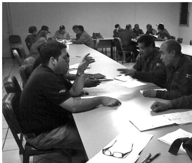
Figura 1 Trabajadores reflexionando sobre su experiencia de participación (taller 1)

En los tres primeros talleres fueron registradas las reflexiones de los trabajadores sobre la visión de